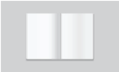
간편 설명서 (e-mail 제공)