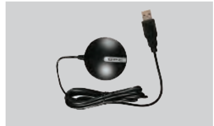
GPS 안테나 (USB 타입)