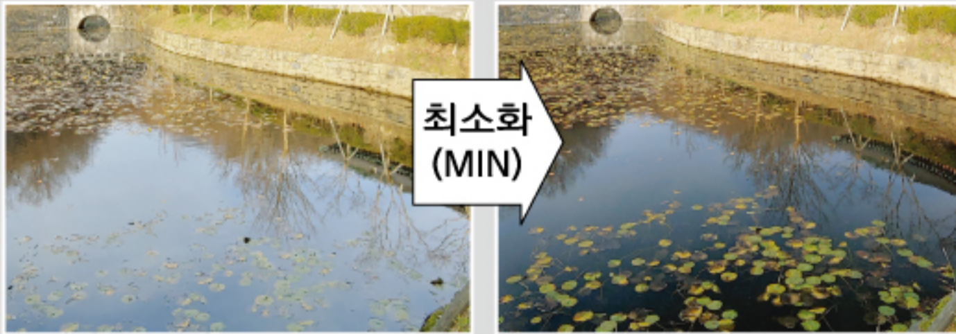
석양, 수면반사 등 제거로 선명한 영상 촬영 가능

기존의 CCTV카메라는 난반사에 의해 “해안가, 지하주차장, 비에 젖은 도로”등에서는 정확한 영상 구현이 어려웠습니다. 사이테크놀로지스의 자동 편광조절 카메라는 난반사를 최소화(Min), 혹은 최대화(Max) 함으로써 사용자가 원하는 영상 구현을 가능하게 합니다.