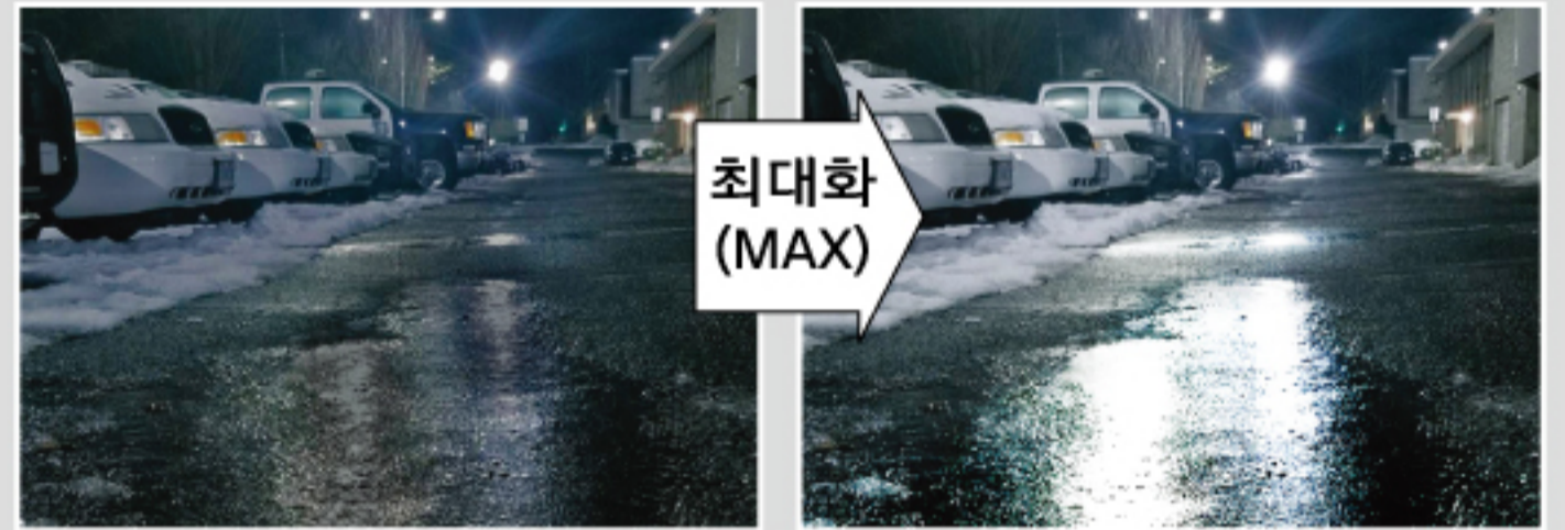
빗길, 빙결 등 감지-교통정보에 활용 가능